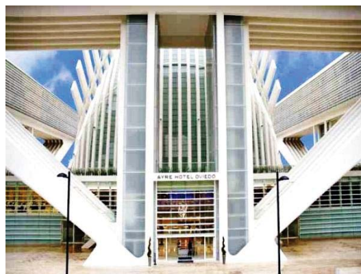
Hotel Ayre ****