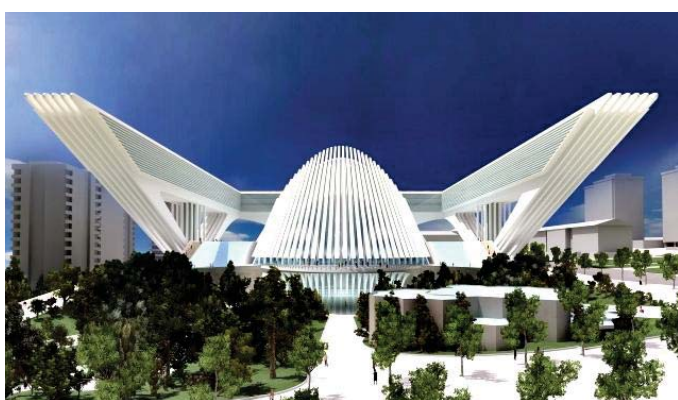
Palacio de Congresos Ciudad de Oviedo

NOTA: Se ruega confirmar asistencia antes del día 7 de Mayo