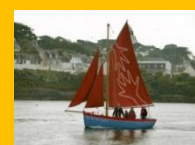
Association La Martine