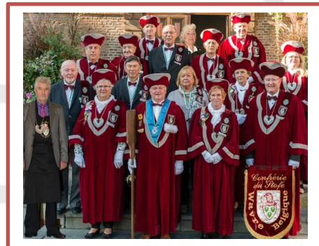
Photo prise lors de notre Chapitre 2017