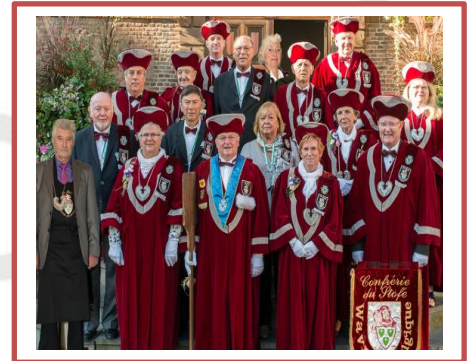
Photo prise lors de notre Chapitre 2017