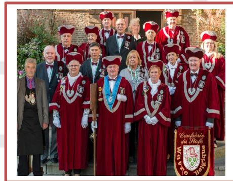
Fotoscattata al nostro Capitolo 2017