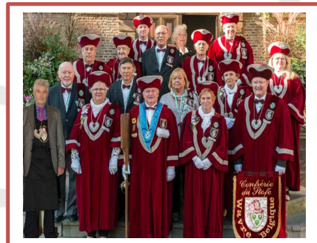
Fotoeditie Chapitre 2017