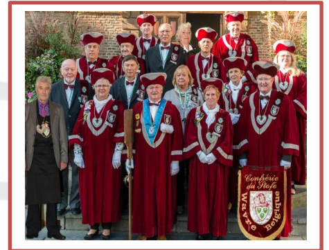
Photo prise lors de notre Chapitre 2017