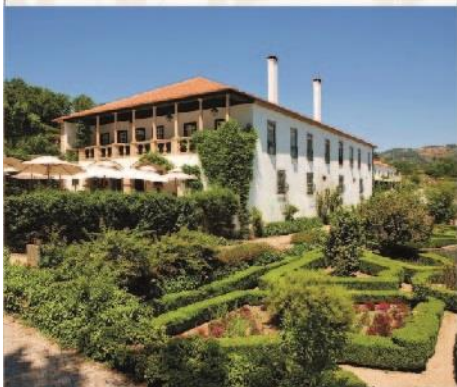
Hotel Rural "Casa Viscondes da Várzea"

254 690 020 Várzea de Abrunhais - LAMEGO