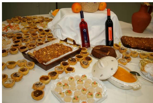
Muestra enogastronómica de las Cofradías de CEUCO