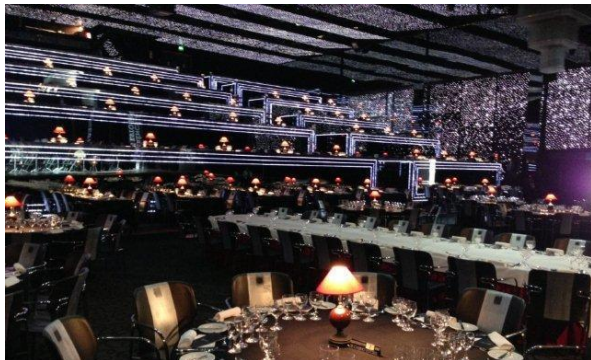
20:30 Cena de gala en el Páteo da Galé