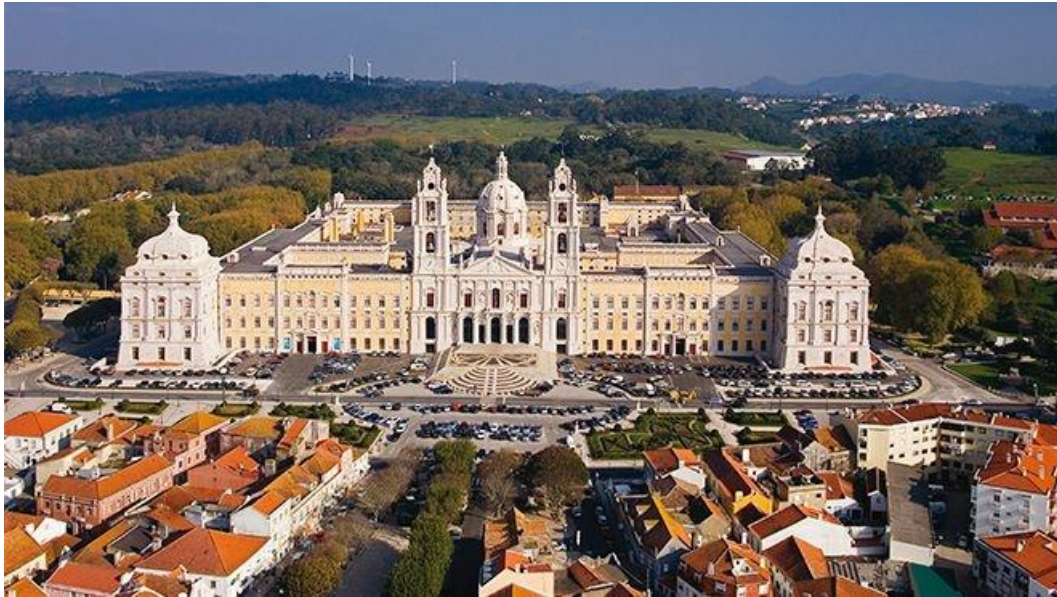
Palazzo Nazionale e Convento di Mafra

Ore 13.30 – Pranzo di commiato nei chiostrii del convento con intrattenimento Ore 17.00 – Conclusione del congresso e ritorno in hotel