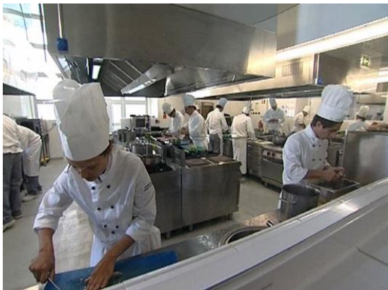
c Mostra di prodotti agroalimentari di qualità