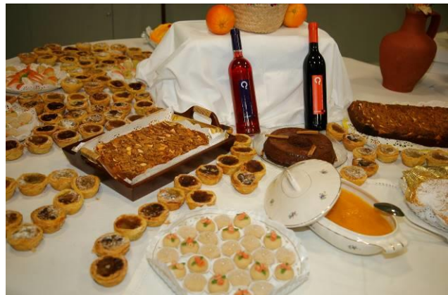
c Salone enogastronomico delle Confraternite CEUCO