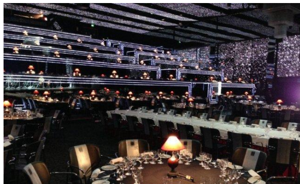
20:30 Jantar de Gala no Páteo da Galé