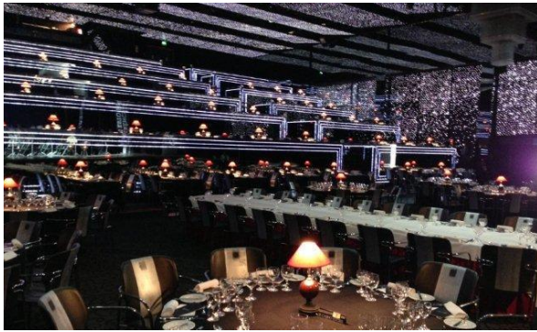
20:30 Jantar de Gala no Páteo da Galé