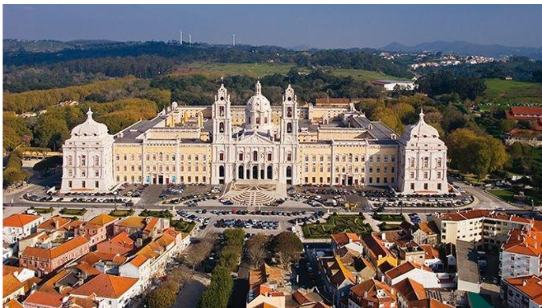
Palácio Nacional e Convento de Mafra

13.30 horas – Almoço de despedida nos claustros do Convento com animação 17.00 horas – Fim do Congresso e regresso aos hotéis