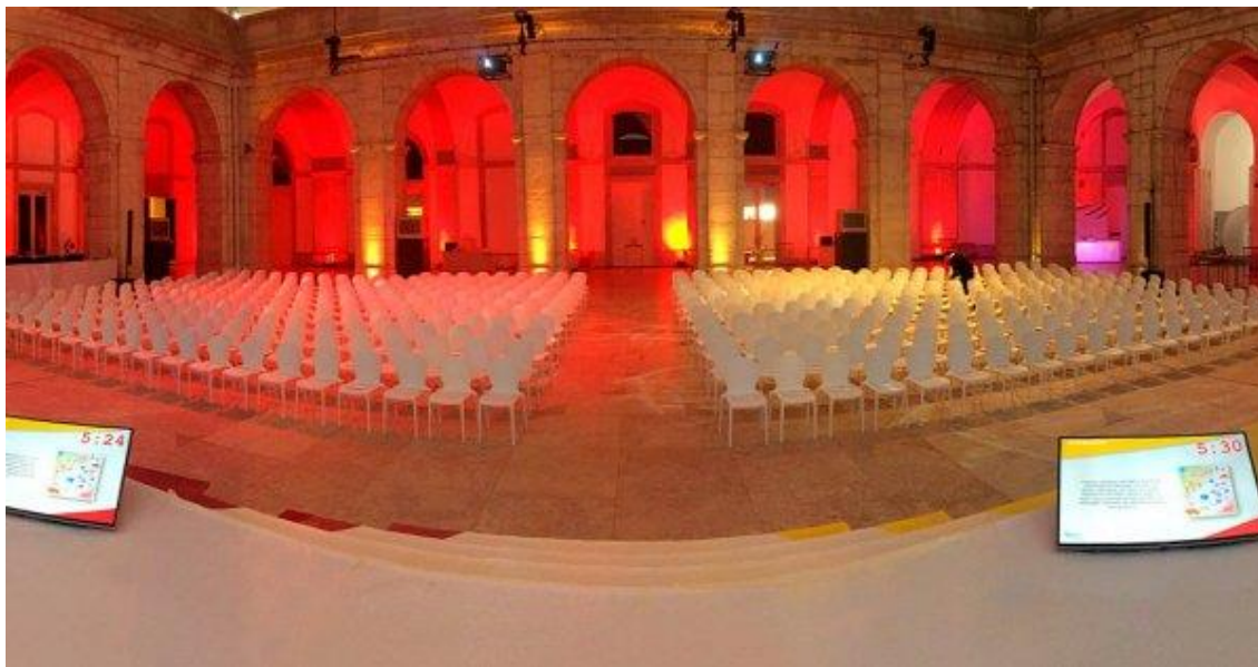
Páteo da Galé